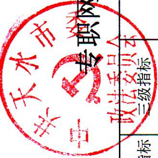
天水市专职网管员队伍以奖代补经费项目支出绩效评价体系评分表